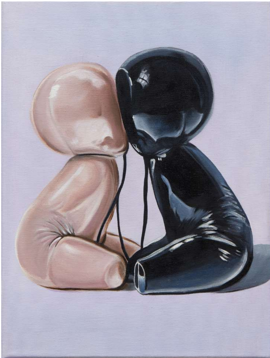
Charlie Stein Encrypted Bodies (Opposites II) , 2025 Oil on canvas 40 x 30 x 2.5 cm (ChS/M 6)