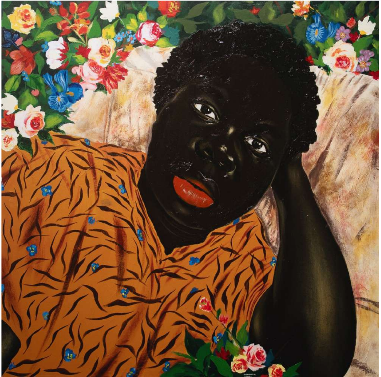
Olasunkanmi Akomolehin When waking hurt (I) , 2025 Oil and Acrylic on canvas 101 x 101 cm (OA/M 43)