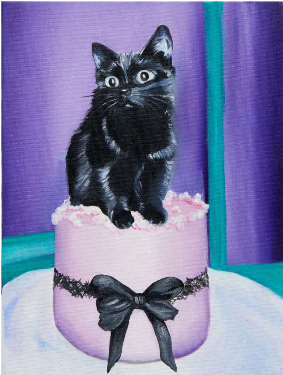
Charlie Stein Untitled (Cake) , 2025 Oil on canvas 40 x 30 cm (ChS/M 8)