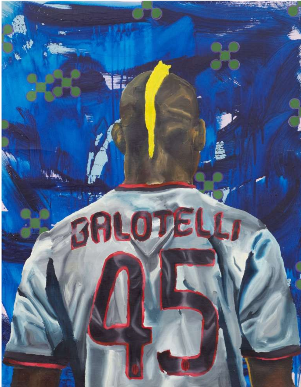
O Bastardo Untitled, 2025 Oil and Acrylic on linen 92 x 72 x 4 cm (OB68/M 1)