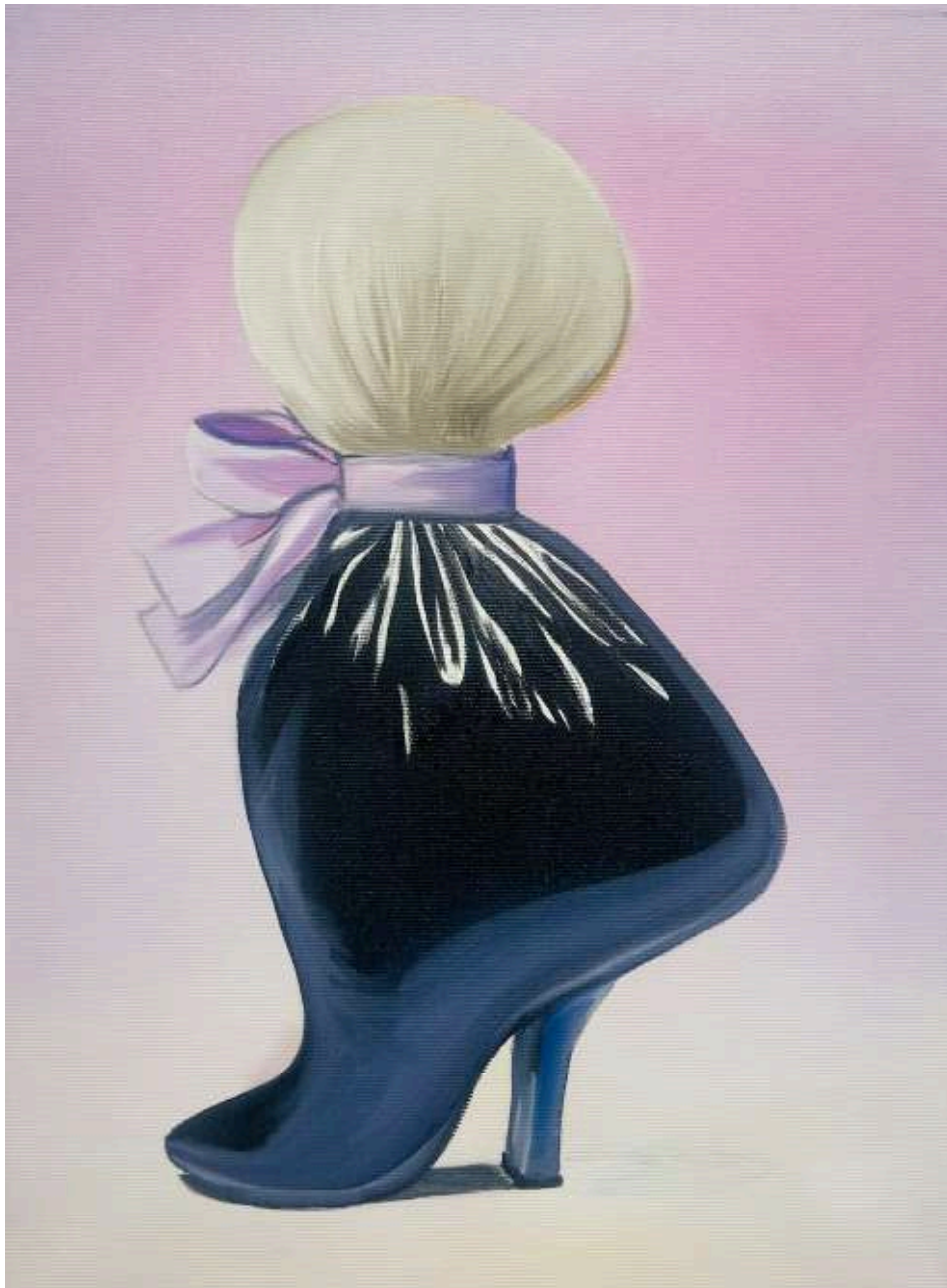
Charlie Stein Hyper Object (Gift) , 2025 Oil on canvas 40x30cm (ChS/M 10)