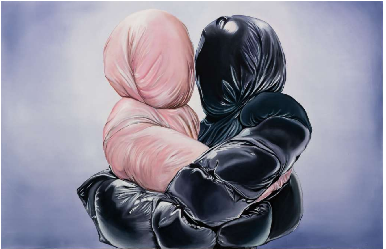
Charlie Stein Virtually Yours (Kiss) , 2025 Oil on canvas 150 x 230 cm (ChS/M 12)