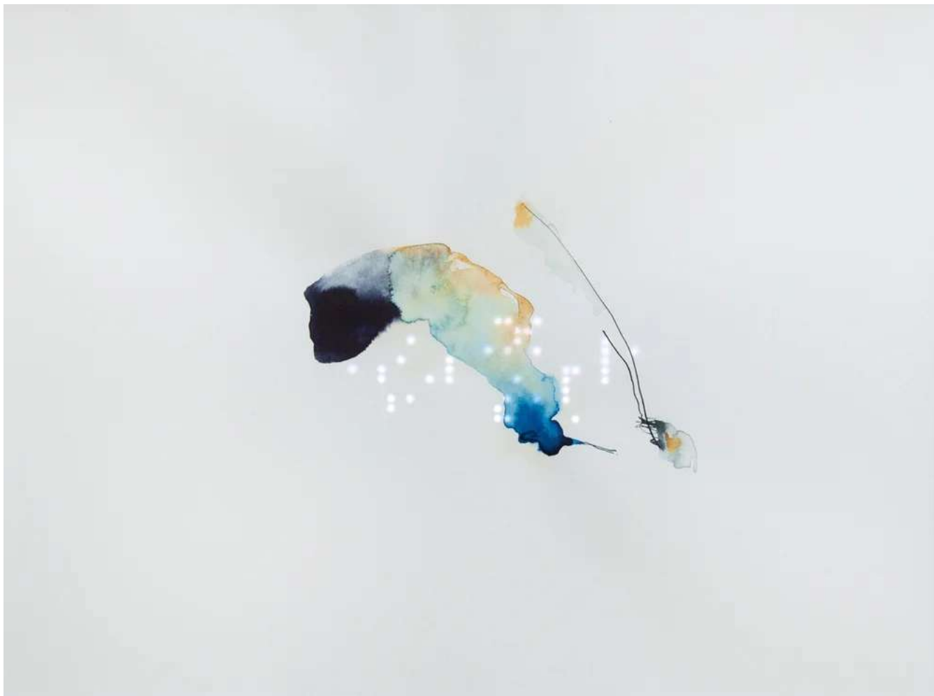
Johanna Reich Die Brücke , 2025 Ink on paper with LED 50 x 60 cm (JR/M 38)