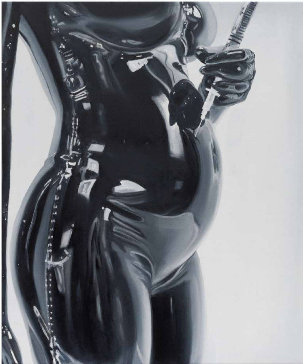
Charlie Stein Thesmorphia (Reproduction 3) , 2025 Oil on canvas 40 x 30 x 7 cm (ChS/M 11)