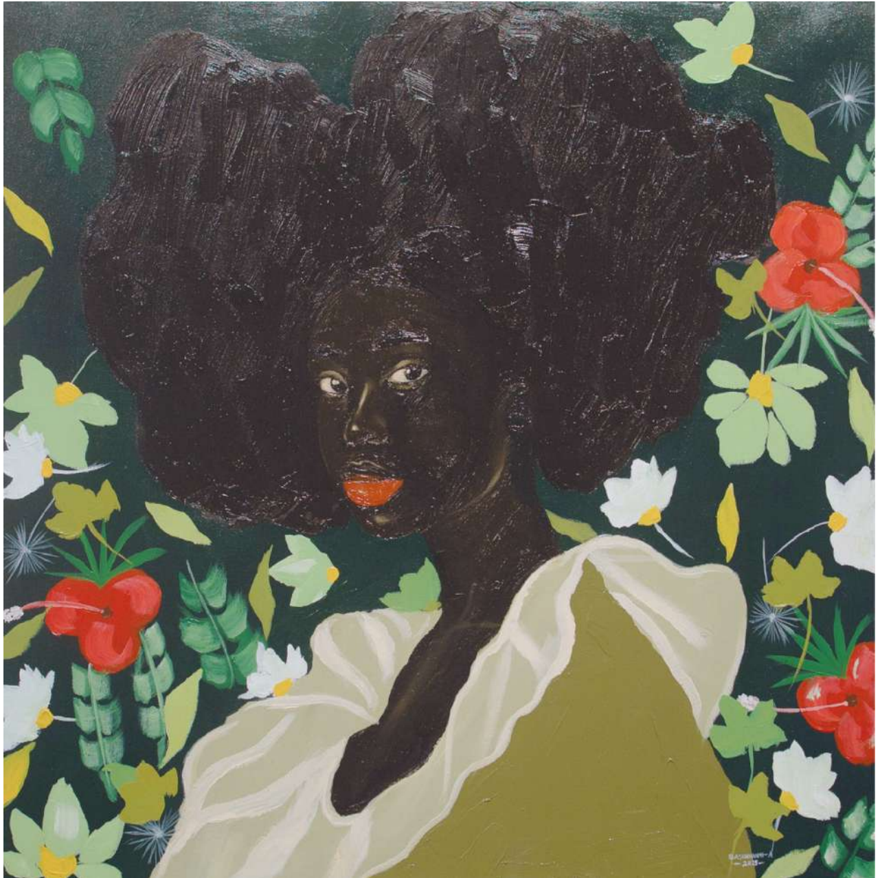
Olasunkanmi Akomolehin Times of Renaissance (IV) , 2025 Oil and Acrylic on canvas 63 x 63 cm (OA/M 46)