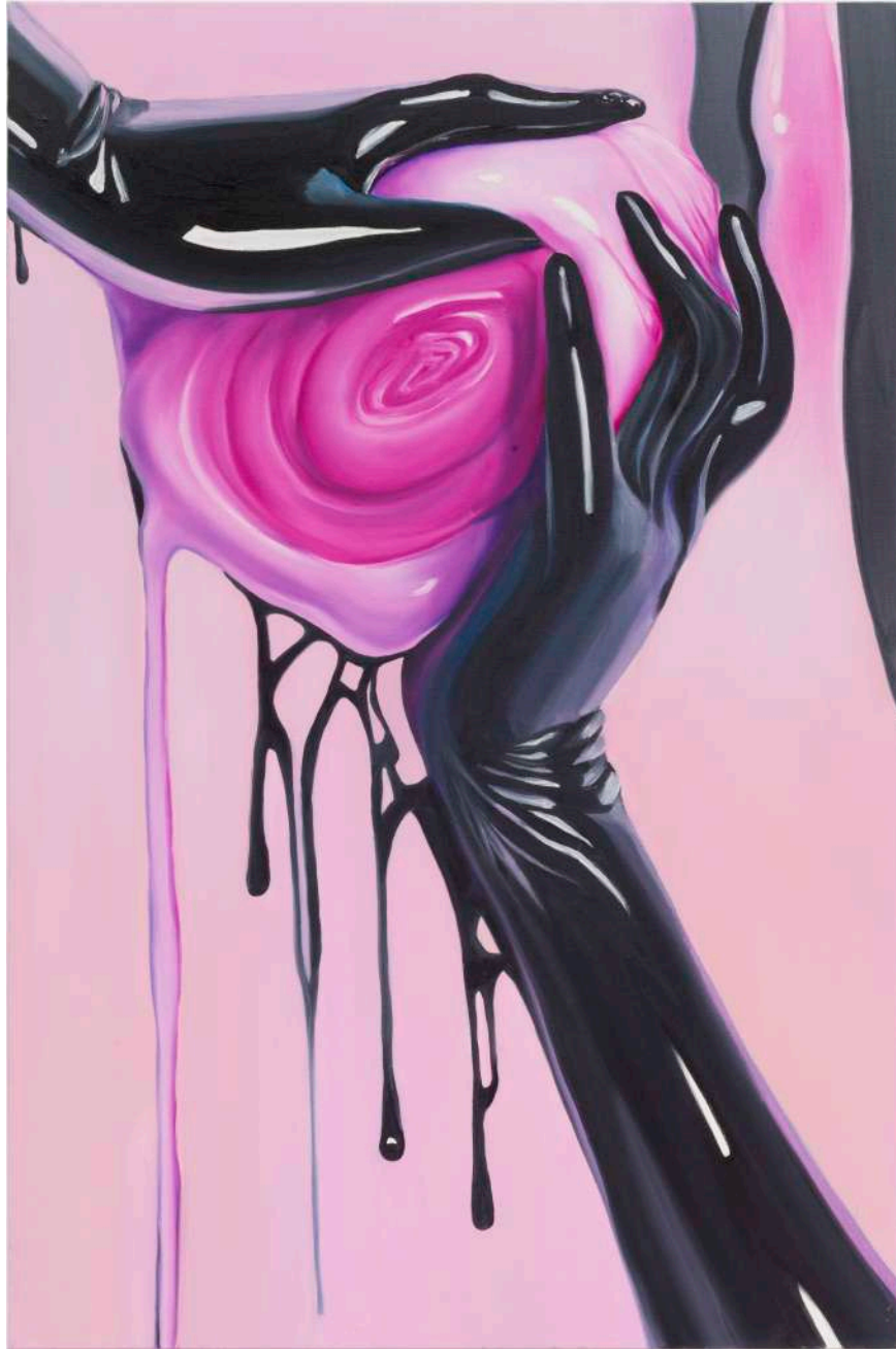
Charlie Stein Virtually Yours (Instant Intimacy) , 2023 Oil on canvas 90 x 60 cm (ChS/M 3)