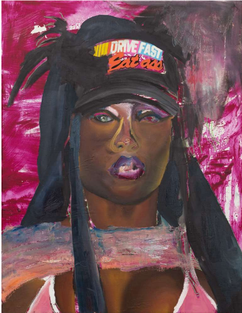
O Bastardo Untitled, 2025 Oil and Acrylic on linen 92 x 72 x 4 cm (OB68/M 3)