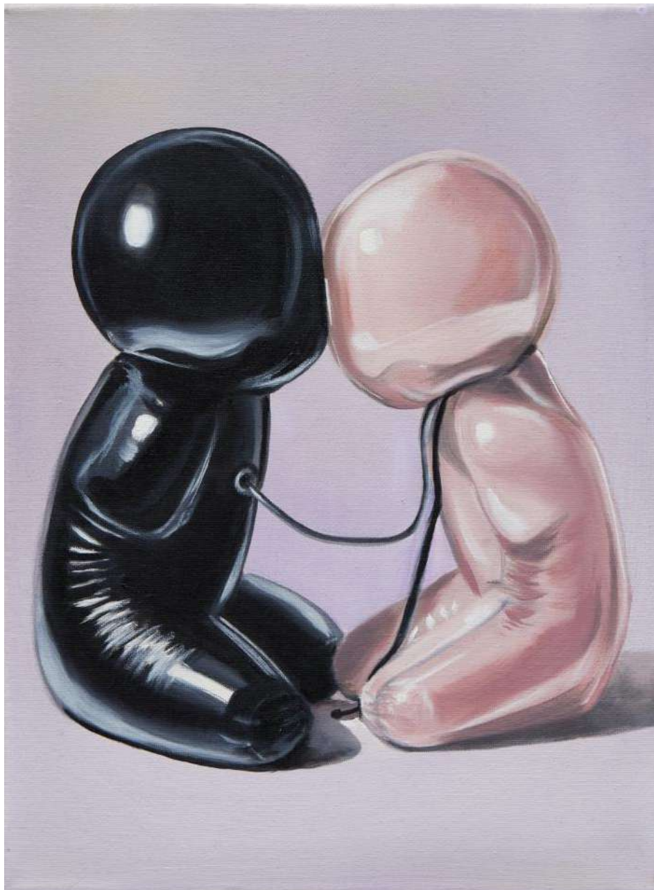
Charlie Stein Encrypted Bodies (Opposites III) , 2025 Oil on canvas 40 x 30 cm (ChS/M 7)