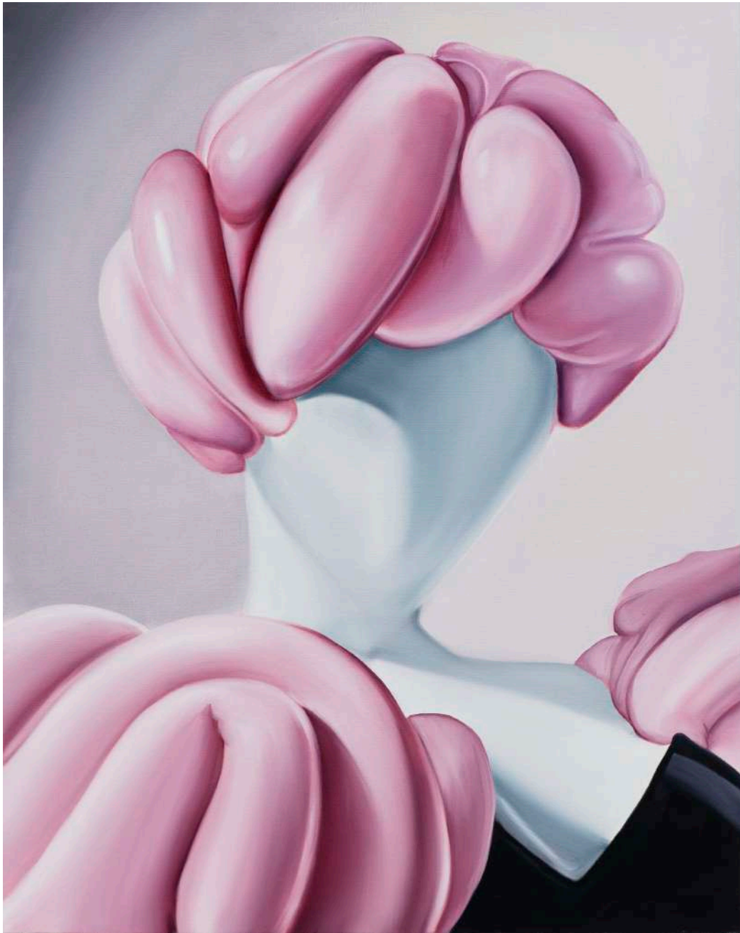
Charlie Stein Parthenogenesis (Medusa) , 2025 Oil on canvas 92 x 73 x 5 cm {ChS/M 13}