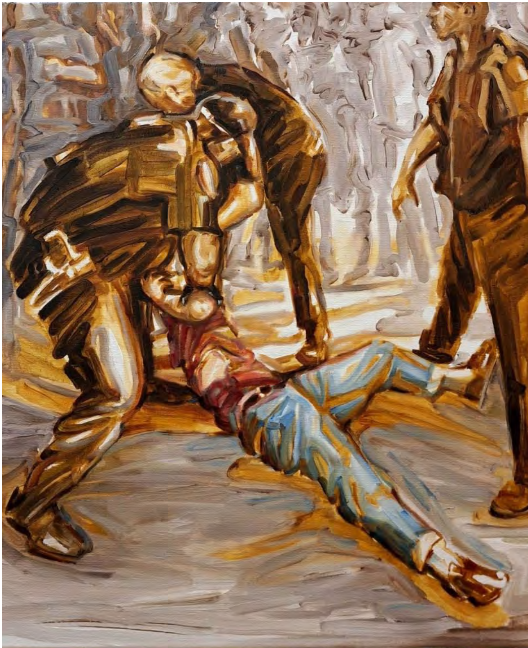
Simin Jalilian Vor Ort , 2025 Oil on canvas 60 x 50 cm (SJ/M 27)