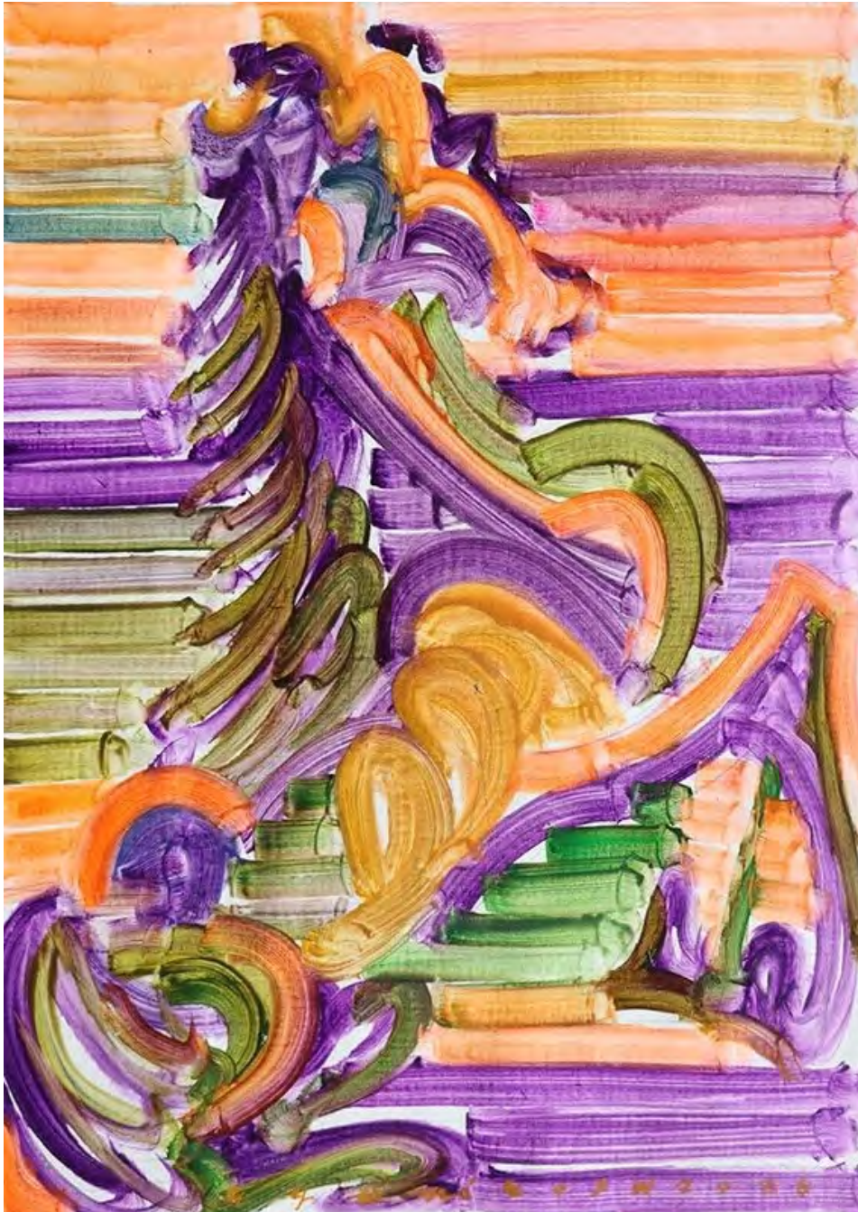
Etsu Egami Pretty Horses , 2026 Oil on canvas 83 x 58 cm (EE/M 15)