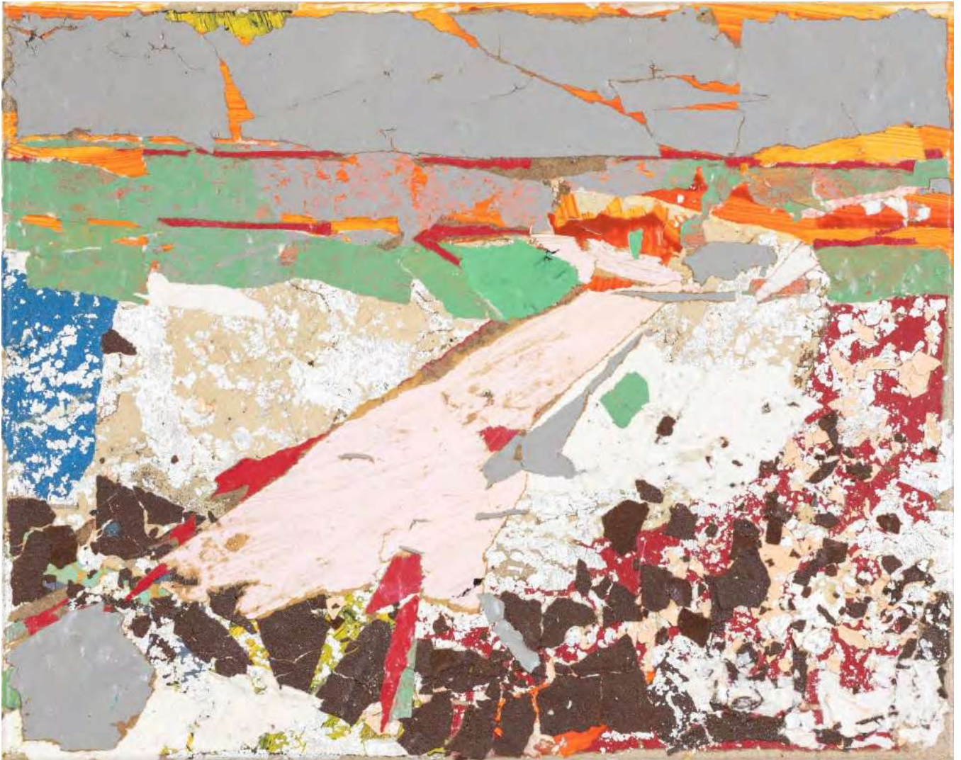
Tammam Azzam Untitled, 2025 Paper collage on canvas 40 x 50 cm (TAZ/M 124)