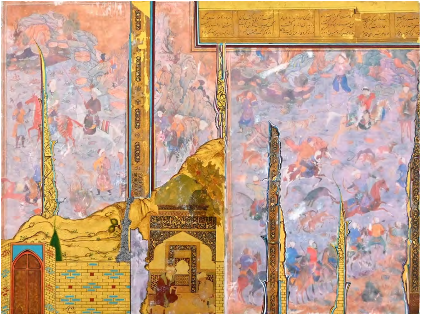
Navid Mashouf My cityscape , 2022 Mixed media on canvas 30 x 40 cm (NavMa/M 01)