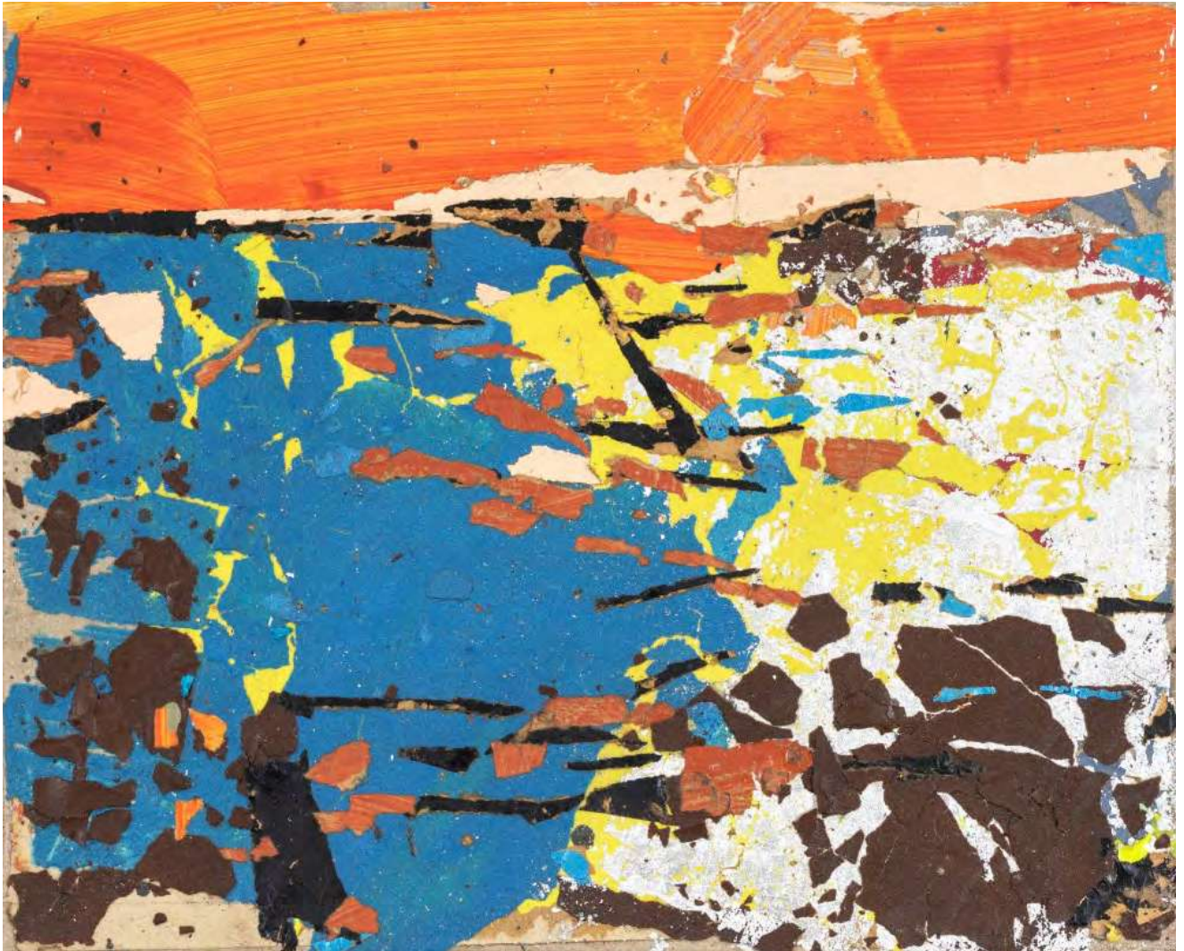
Tammam Azzam Untitled, 2025 Paper collage on canvas 40 x 50 cm (TAZ/M 123)