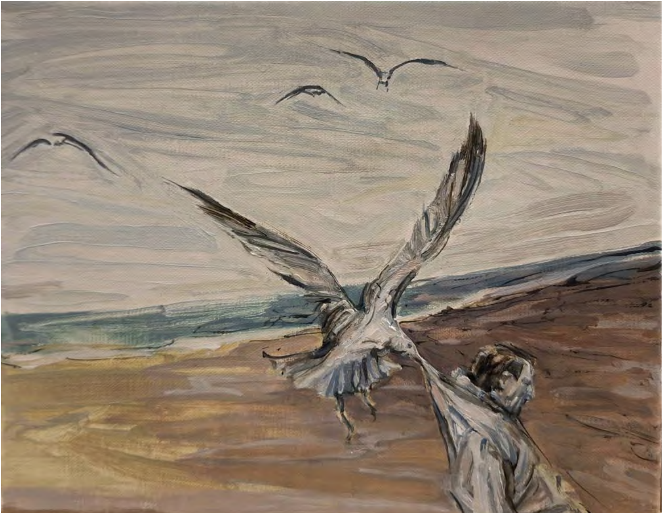
Simin Jalilian Zum Mitnehmen , 2025 Oil on canvas 24 x 30 cm (SJ/M 33)