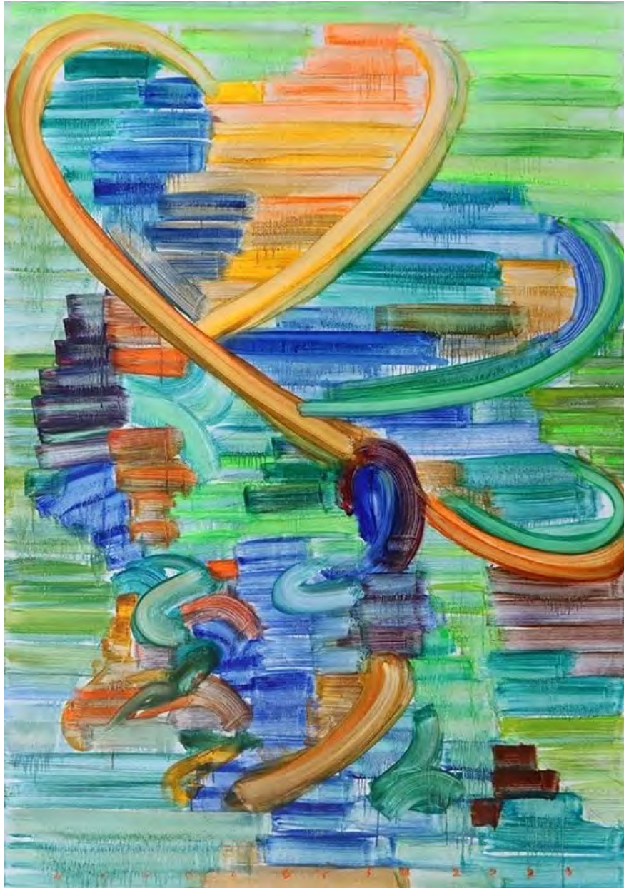
Etsu Egami Oriental Mystery , 2024 Oil on canvas 199 x 141 cm (EE/M 11)