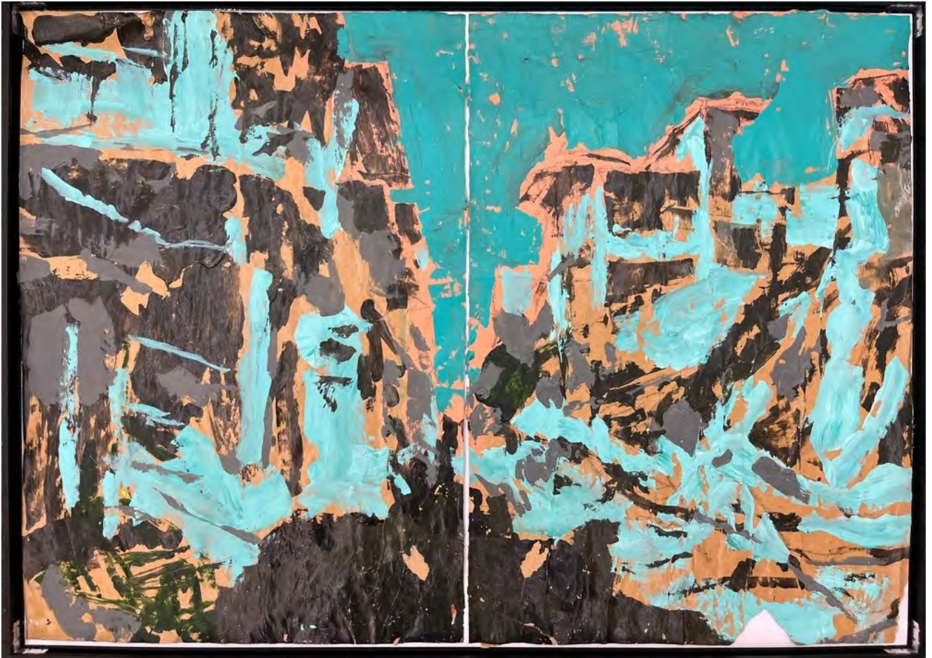
Tammam Azzam Cities and one Sky, 2021 Acrylic on paper 49.5 x 69 cm (TAZ/M 99)