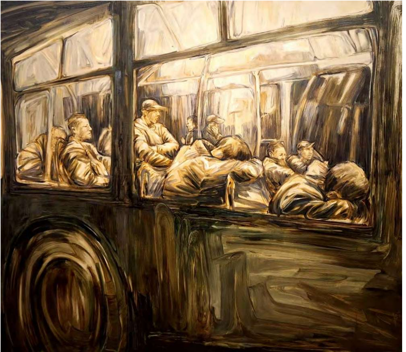
Simin Jalilian Nachtbus , 2026 Oil on canvas 165 × 190 cm (SJ/M 40)