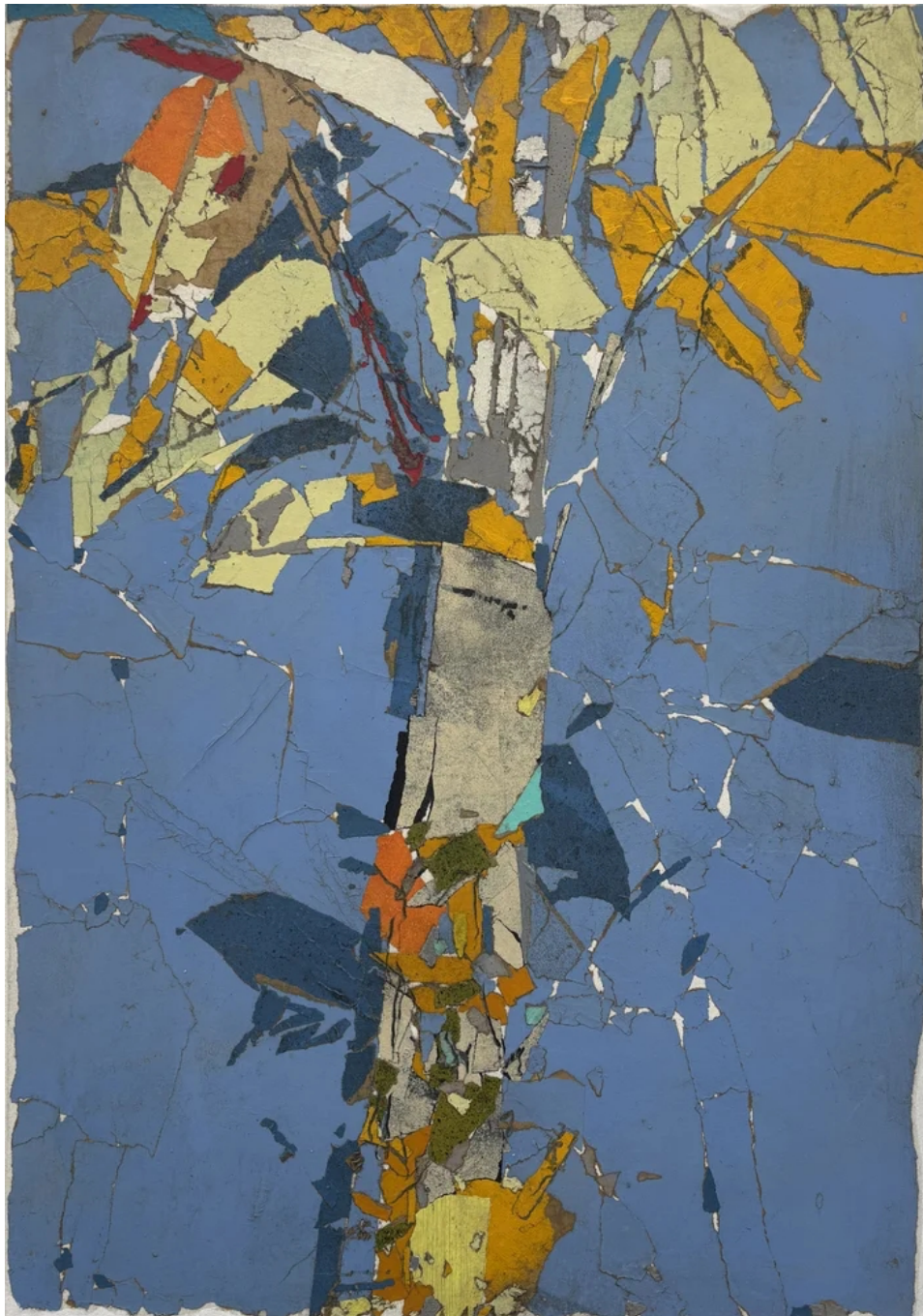
Tammam Azzam Untitled, 2026 Paper collage on canvas 100 x 70 cm (TAZ/M 130)