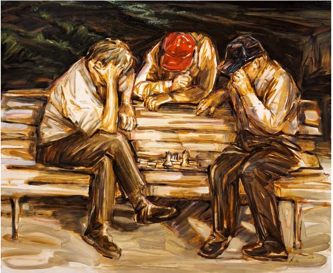
Simin Jalilian Messing It Great Again, 2026 Oil on canvas 50 x 60 cm (SJ/M 41)