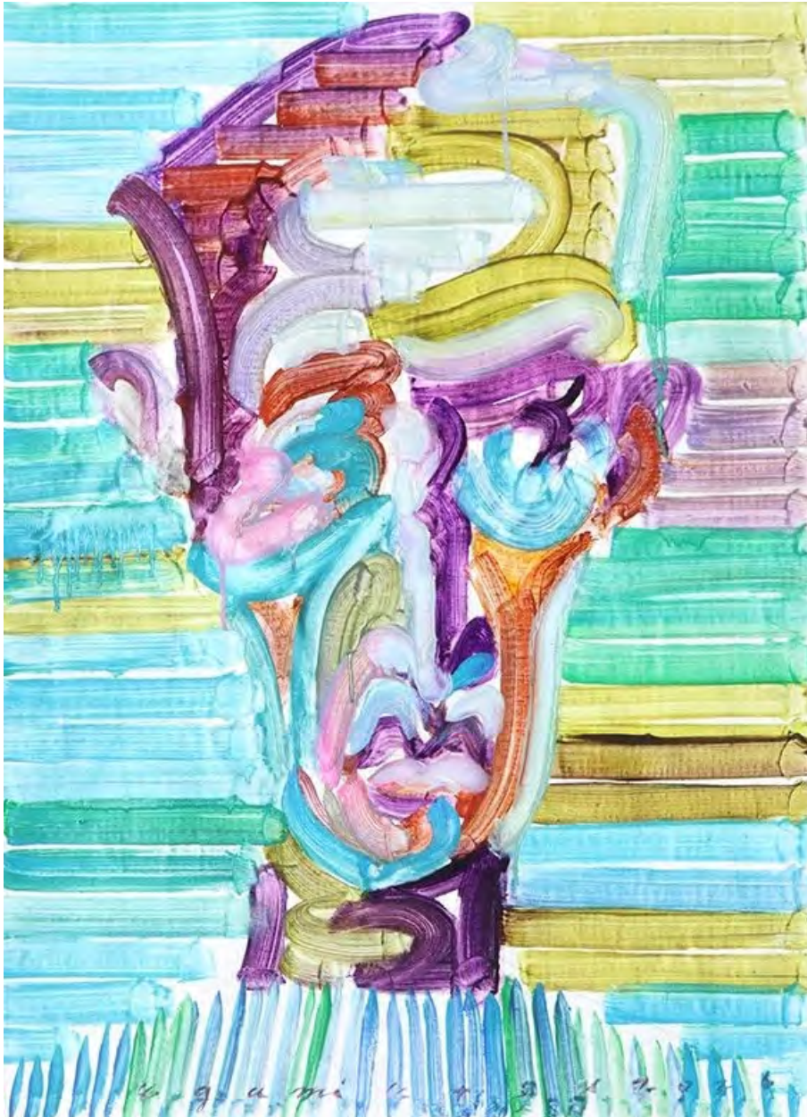
Etsu Egami Song of traveller, 2026 Oil on canvas 82.5 x 60 cm (EE/M 14)