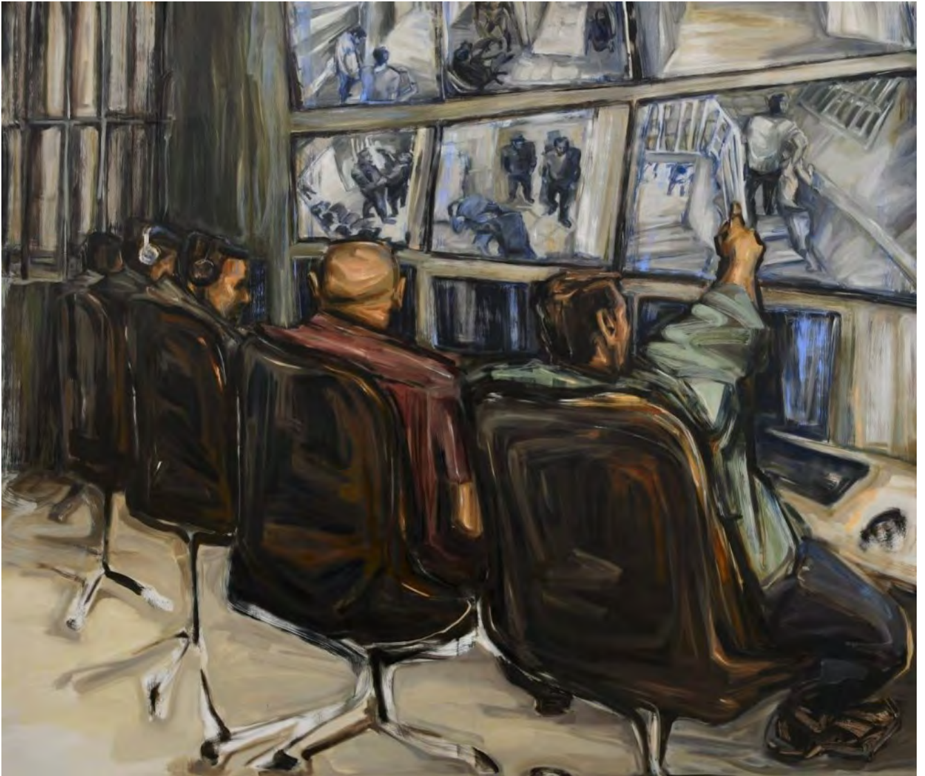
Simin Jalilian Big Brother is Watching You, 2022 Oil on canvas 170 x 200 cm (SJ/M 21)