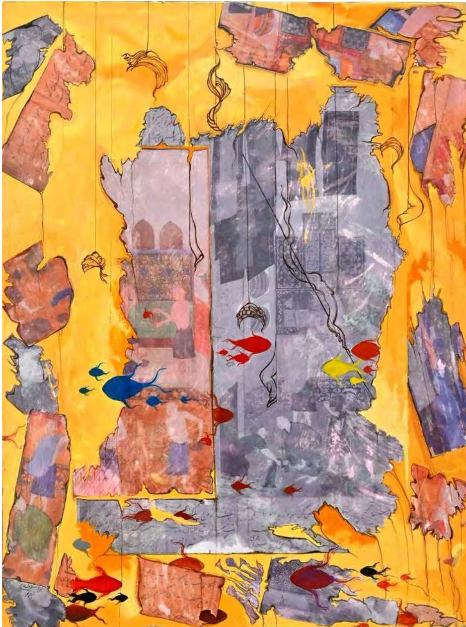
Navid Mashouf Destruction , 2021 Mixed media on canvas 40 x 30 cm (NavMa/M 02)