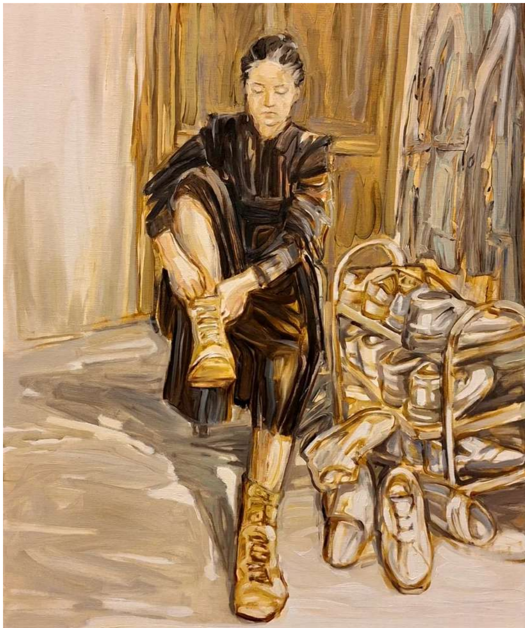
Simin Jalilian Vorwärts , 2026 Oil on canvas 50x60cm (SJ/M 42)