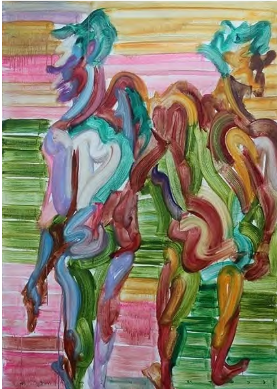
Etsu Egami Social Distancing , 2023 Oil on canvas 197 x 141 cm (EE/M 12)