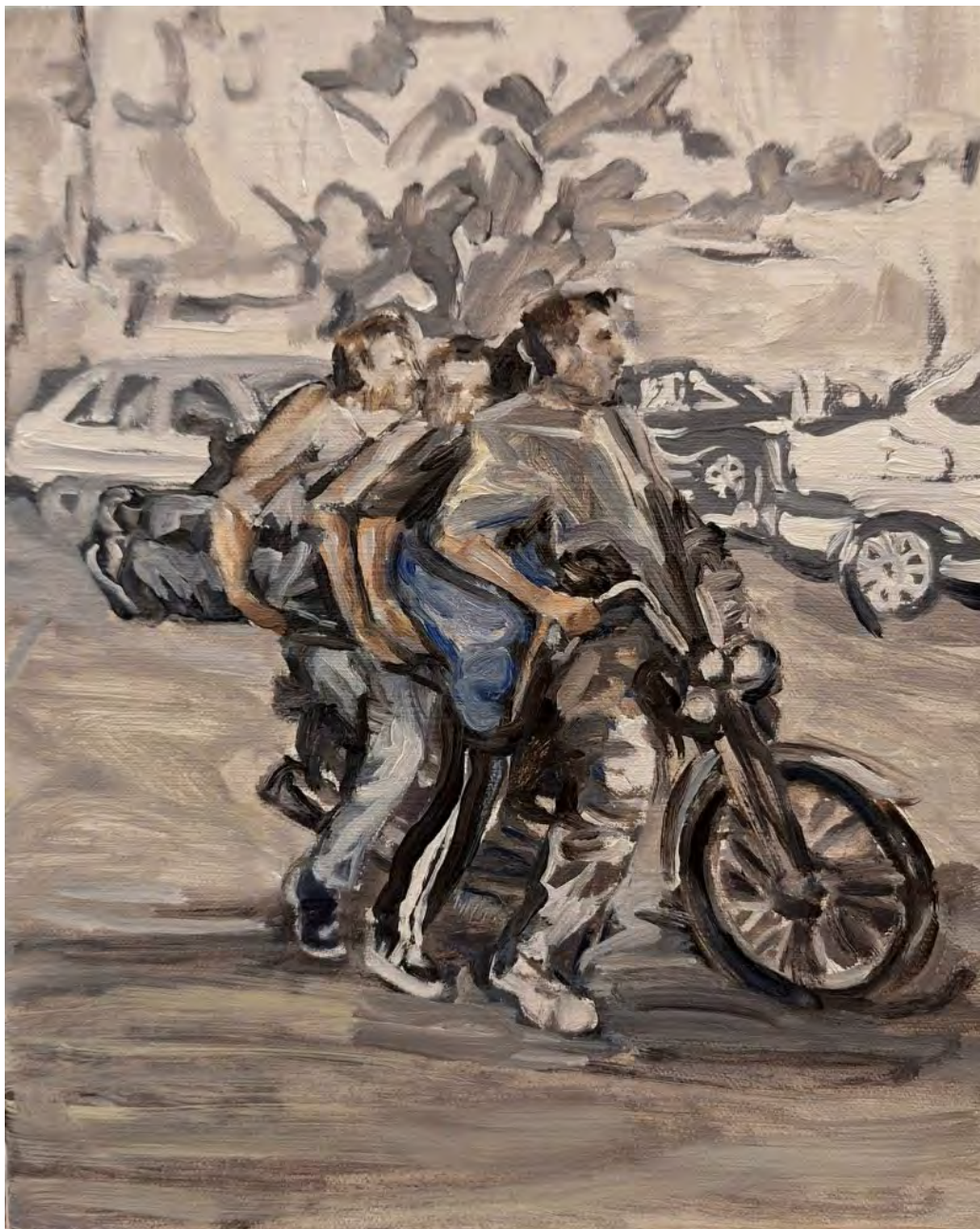
Simin Jalilian Mitgenommen , 2025 Oil on canvas 24 x 30 cm (SJ/M 34)