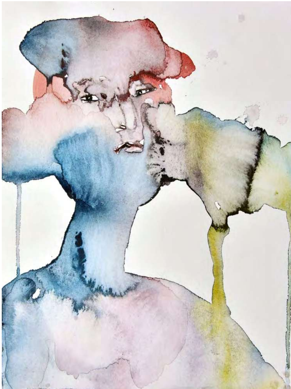
Tamara Kvesitadze Untitled, 2017 water colour on paper 32 x 24 cm (TK/P 34)