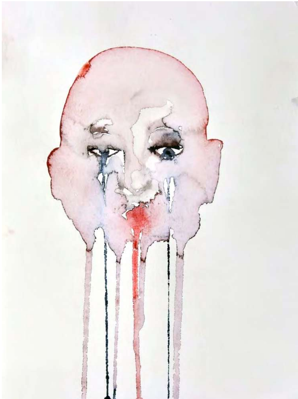
Tamara Kvesitadze Untitled, 2017 water colour on paper 32 x 24 cm (TK/P 35)