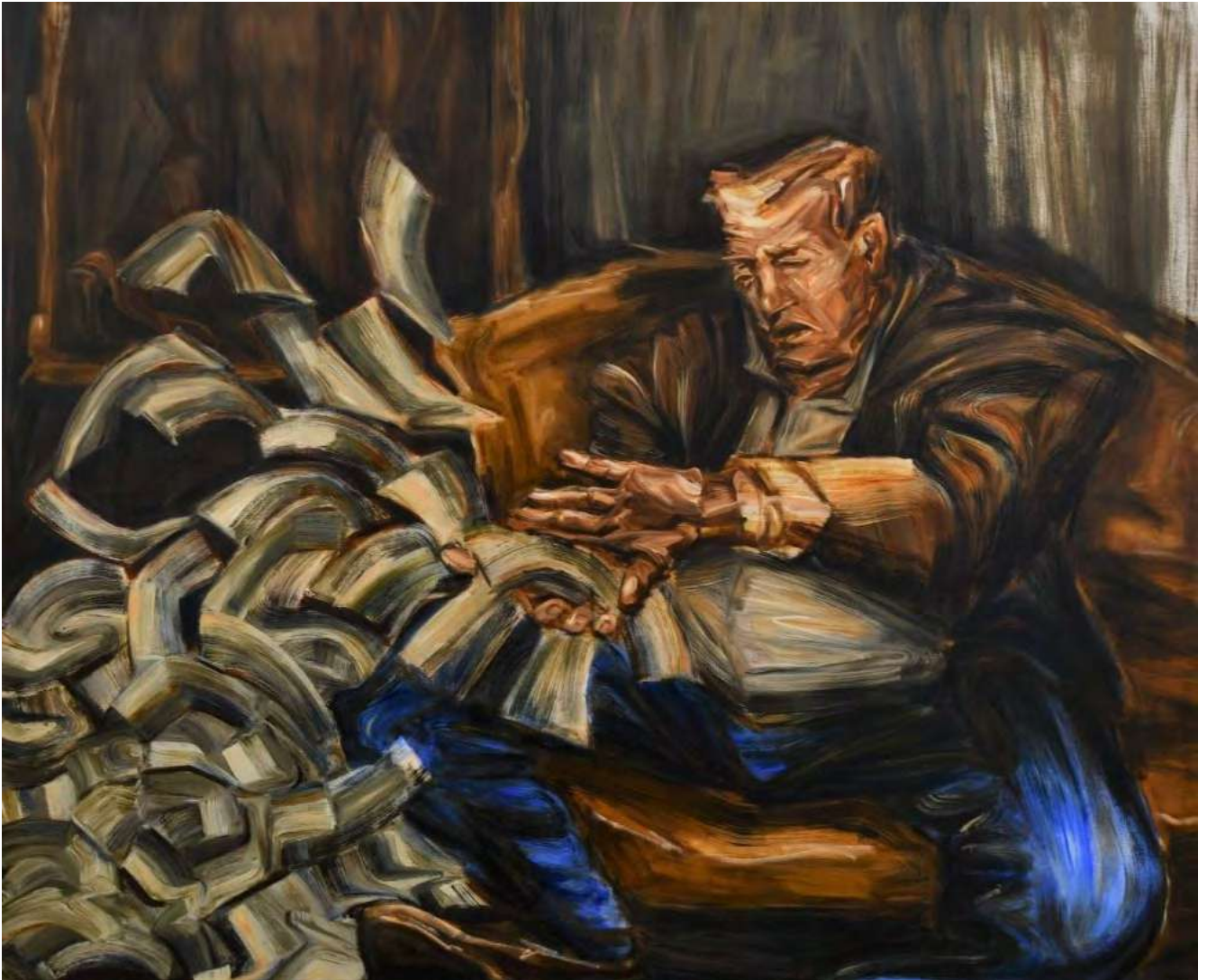
Simin Jalilian American Dream , 2022 Oil on canvas 160 x 195 cm (SJ/M 19)