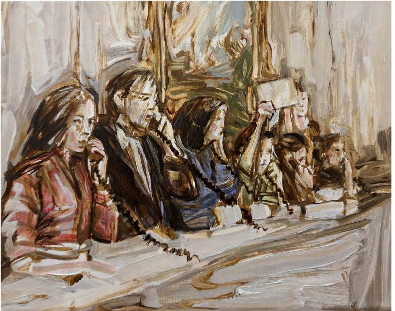
Simin Jalilian Auktion, 2025 Oil on canvas 24 x 30 cm (SJ/M 32)