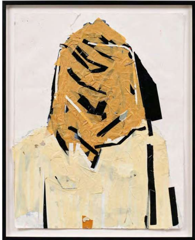
Tammam Azzam Untitled, 2016 adhesive tape on paper 65 x 50 cm (TAZ/P 18)