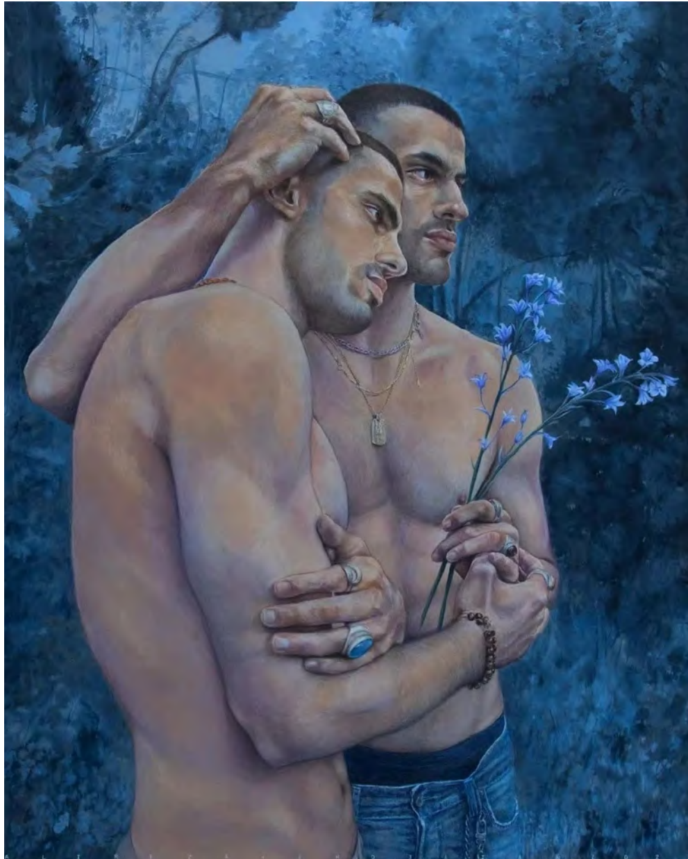
Alireza Shojaian Mystic Blue , 2023 Acrylic, crayon on wood 110 x 90 cm (ASh68/M 1)